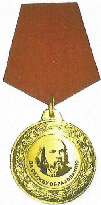
Медаль «ЗА СЛУЖБУ ОБРАЗОВАНИЮ»